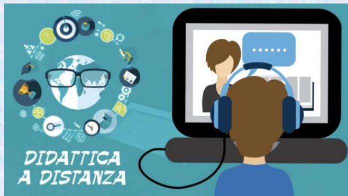
DIDATTICA DIGITALE INTEGRATA - CLASSROOM