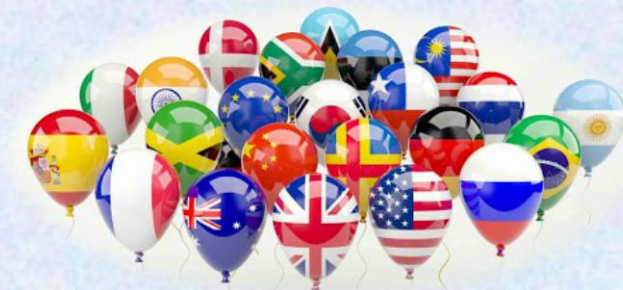
CORSI DI LINGUE