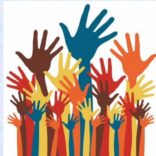
CONSIGLIO COMUNALE DEI RAGAZZI