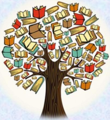
TEMA DELL'ANNO D'ISTITUTO Racconti-AMO-ci