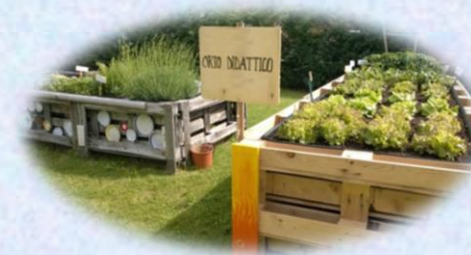
ORTO DIDATTICO - GREEN LAB