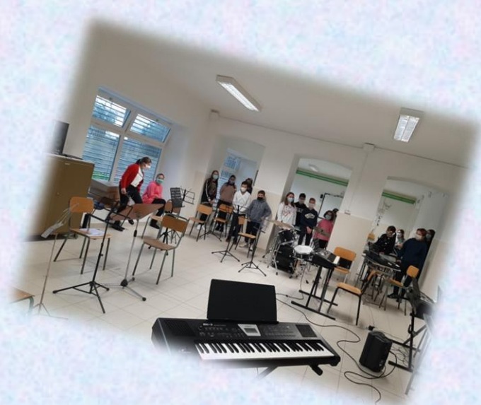
AULA DI MUSICA BIBLIOTECA CAMPI SPORTIVI LABORATORI DISCIPLINARI