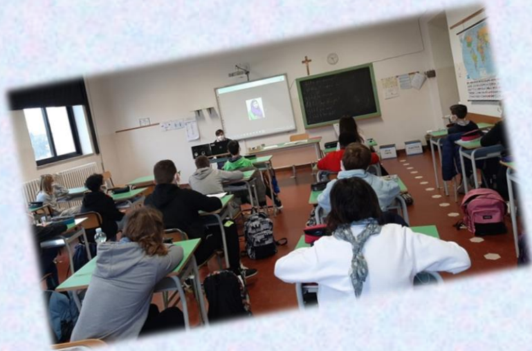
AULE ATTREZZATE CON LIM